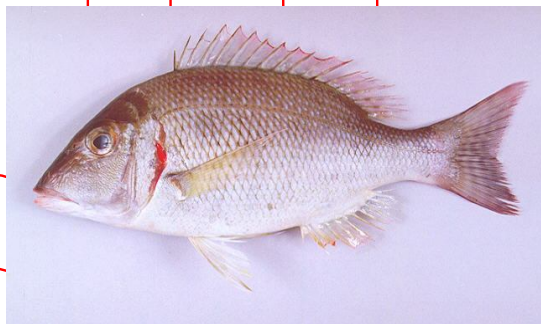
نگاره ۱- ماهی شهری گوش قرمز Lethrinus lentijan

تاریخ دریافت: ۹۲/۲/۱۲ تاریخ پذیرش: ۹۲/۳/۲۷